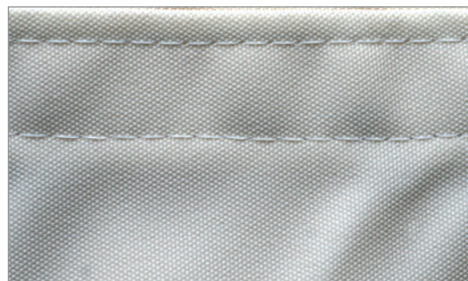
Polyester - vandtæt

Kontakt din salgskonsulent for råd og vejledning og indhent et godt tilbud på solsejl.